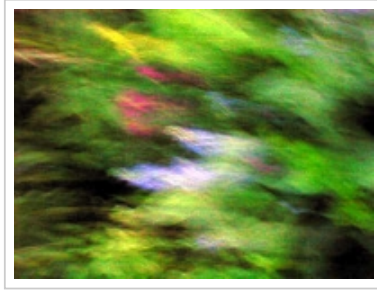
ツイート シェア 0

なっていたというもの。私の持っているデジカメはマニュアル撮影できないからこうするしかないのだ。でもこの2枚き気に入っている。