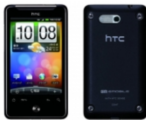
HTC Aria S31HT

まずauのはじめのアンドロイドが無料で出ていて、通話をしなければ月8円で運用できると聞いてショップを回った。飯田橋に1台あったが予約済み。他の店は完売ということではなかった。次はドコモのギャラクシータブ。これも年末・年始にあるところでゼロで売られたようで、これも通話なしで使おうと探す。結局最安は1万円弱。どうしようかと迷っていたらイーモバイルのアンドロイドはワイファイポケットとルーターにもなっていて、最大8人までつなぐことができるとのこと。最悪ワイファイで使えるし、EM-ONEとノートパソコンでも使える。無線LANもヨドバシのワイヤレスゲートに入っはいたが、いざというときに繋がらないときがあったのだ。そこそこ払う必要がるけど、私にはこれかなっ、と現物を見て購入。