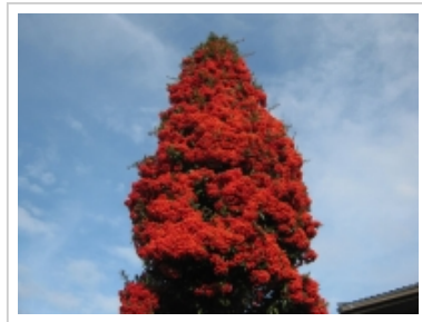
昨年の正月に撮った、赤の方が多い南天の木。

自家用2輪車だとつい寄り道をしてしまうのだが、電車だと寄り道をせざるに帰る。結局雨には遭わなかった。後でニュースで首都圏でも雪が少し舞ったというのがアレだったのかも。鶴屋八幡に行くとも今年もあとわずかかと実感。