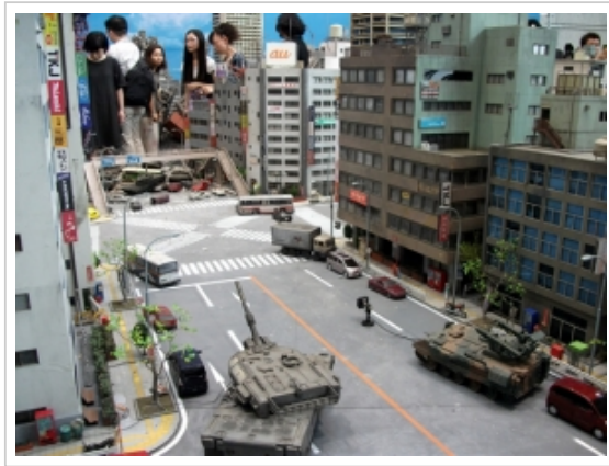
ツイート シェア 1

■ 鉄分を補給したい方は……「Toy-train」へ ■ comments(0) | trackbacks(0) |