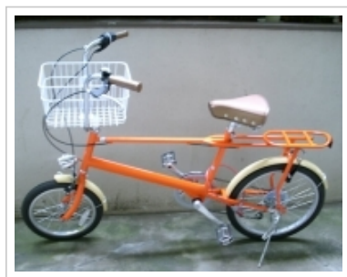
ツイート シェア 2