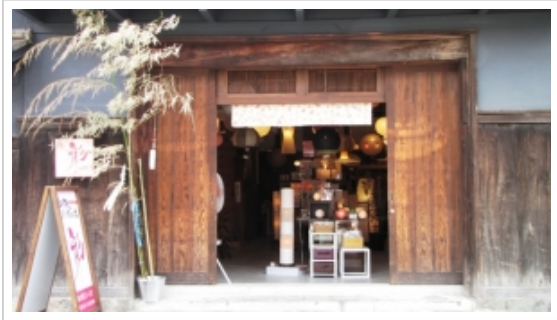
ツイート シェア 2

■ 鉄分を補給したい方は……「Toy-train」へ ■ comments(0) | trackbacks(0) |