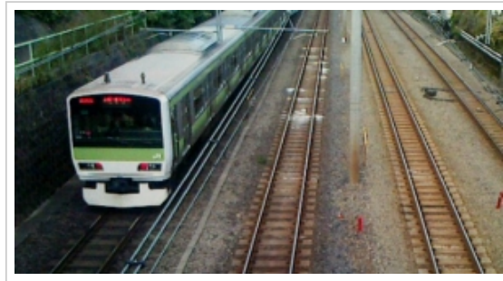
ツイート シェア 2

話しがそれだがトイレで一息ついたら疲れがドツとでたのか、「行く」という気が萎える。またトイレ症状が出るかもしれない。帰ることにする。それで翌日自家用2輪車ではなく、電車で巣鴨へ行く。体力、気が衰えてきたと実感。