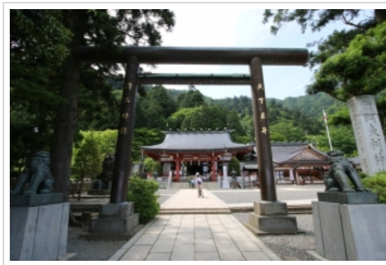
▲大山阿夫利神社下社