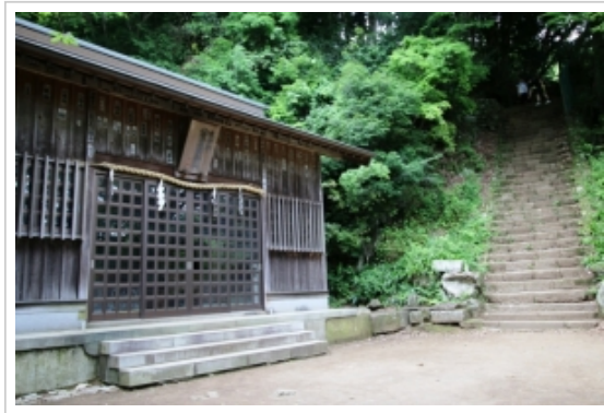
▲ここから左が女坂。右が男坂

緑のもみじが多いから、紅葉の頃来るときれいだろうと思いながら来たルートに戻る。気が付いたら左足の膝が痛い。どうやら下りで捻ったようで、駅の階段が辛かった。