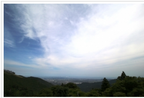
▲大山阿夫利神社の下社からの絶景