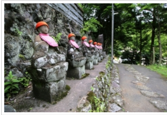
▲茶湯寺なんというのもあった