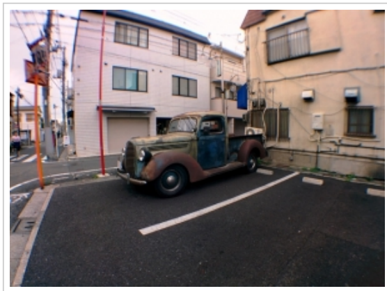
▲自撮りレンズを装着すると