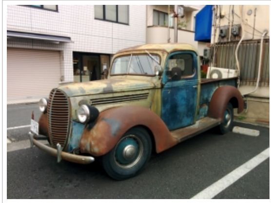
▲自撮りレンズなしだと