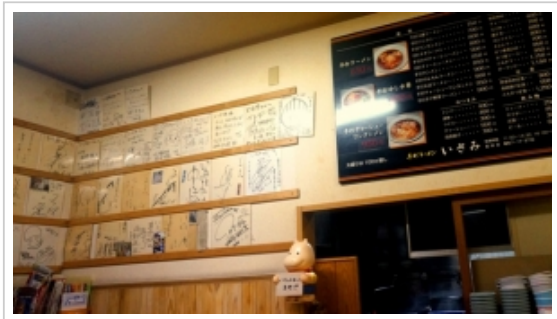
ツイート シェア 2

■ 鉄分を補給したい方は……「Toy-train」へ ■ comments(0) | trackbacks(0) |